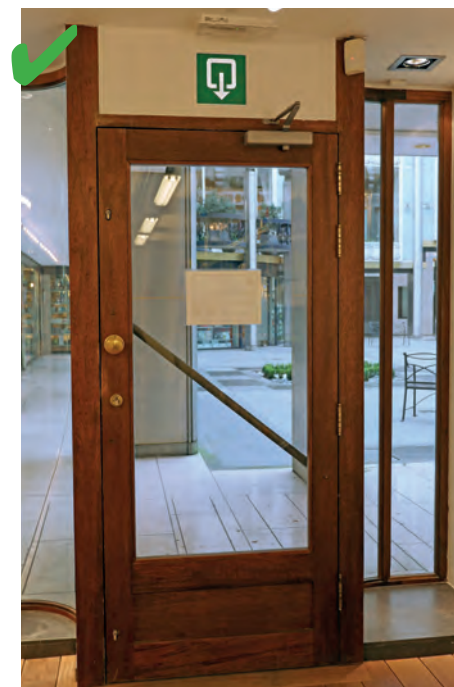
☺ Une issue de secours est prévue. La porte mesure 0,90 m de large, ce qui permet à une personne en fauteuil d'évacuer.