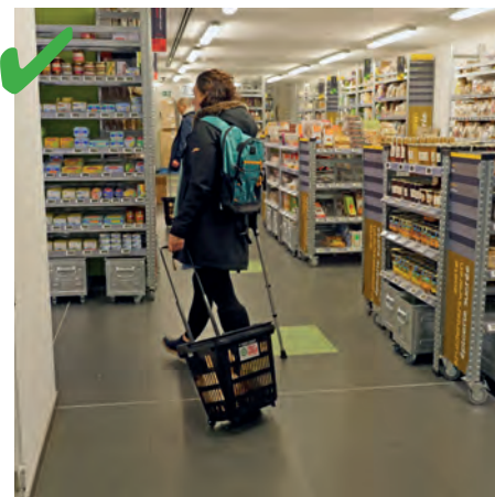
☺ Les allées sont suffisamment larges pour que les clients puissent se croiser. Ici une personne est équipée d'une béquille et d'un caddie mais peut tout de même circuler sans souci. De plus, il n'y a aucun obstacle au sol.