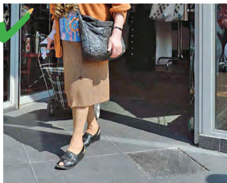
☺ Exemple d'une entrée de magasin plain-pied.