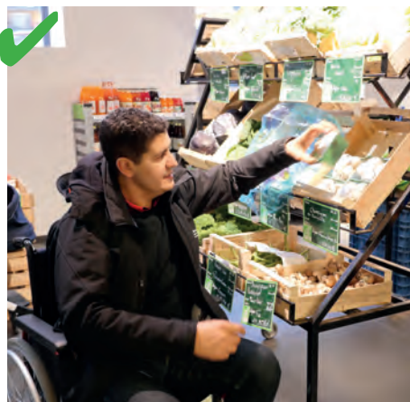
☺ Des présentoirs sont assez bas, les marchandises sont atteignables pour les personnes de petite taille et celles en fauteuil.