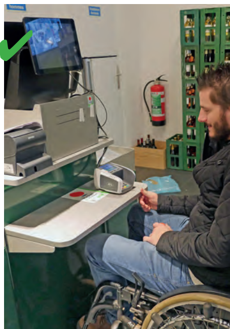
☺ Le comptoir comporte une partie abaissée à 80 cm du sol, ce qui permet à tout le monde d'effectuer une transaction sans tracas.