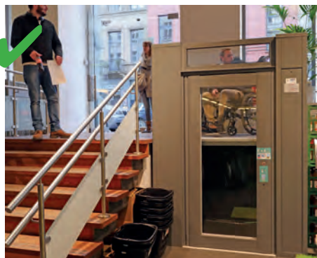
☺ Un monte-charge a été prévu, ce qui profite aux personnes avec un landau ou un fauteuil.