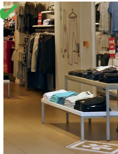
☺ Les présentoirs permettent d'attraper les produits entre 0,50 m et 1,30 m du sol.