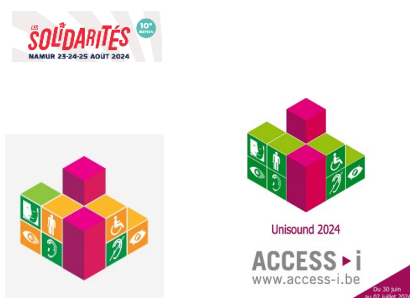
Exemple de visuel des résultats en 2024

Sous la législature 2015-2019, ces mêmes montants ont pu être octroyés aux mêmes conditions. Malheureusement, Esenca, en qualité de service-conseil (notre service « Handyaccessible »), mais aussi d'ASBL défendant les droits des personnes en situation de handicap, déplore qu'aucune obligation de résultats ne soit liée à la subvention. Par cela, nous entendons que malgré l'accompagnement réalisé avec le soutien des services-conseils, les organisatrices et organisateurs de festival n'ont toujours pas pour objectif l'autonomie complète des PSH dans ce type d'événement, et ce pour tous types de handicaps. Les résultats de la certification ne sont donc pas de la couleur verte pour tous les types de handicaps.