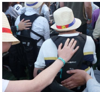
Gilet vibrant utilisé par un festivalier assis, mais également par ces voisins en y apposant leurs mains pour ressentir également les vibrations

Sous la législature 2019-2024, la Région wallonne octroie des subsides ponctuels à l'un ou l'autre festival, mais sans réelle politique d'accessibilité ambitieuse. Cependant, sous l'impulsion des services-conseils en accessibilité qui les accompagnent, plusieurs festivals fournissent des efforts supplémentaires d'année en année en y intégrant en 2023 par exemple des gilets vibrants pour les personnes sourdes ou présentant des troubles autistiques ou cognitifs, la mise à disposition de plan en relief pour les personnes aveugles et malvoyantes, etc. Nous observons donc une certaine volonté d'amélioration dans le chef des festivals.