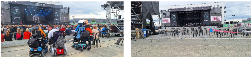
Espace réservé PMR sur la route surélevée par rapport à un parking existant en contre bas accueillant la fosse et ces milliers de festivaliers

Quand l'infrastructure du festival le permet, il convient de privilégier les opportunités de relief sur place ou de kiosque pour avoir une zone PMR surélevée et adaptée en toute sécurité sans avoir recours à un podium.